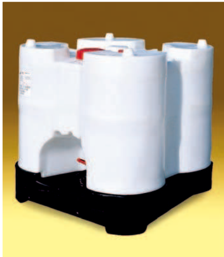
Transicuba plástico 800 lts., Dim. 1160x1160x1155 mm. Válvula de venteo, Tapa Roscada DN 150, válvula de esfera DN 50. Peso en vacío 81 Kg,