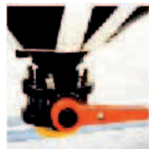
Válvula de Mariposa= Vaciado total.

Dimensiones ext. 1250x944x1900 mm. Capacidad 1000 lts. Peso en vacío 138 kg. Peso máximo en Carga 1444 kg. Apilado en carga 2/1 con carga 1440 kg. Llenado boca de acceso e inspección diam. 400 y Tapa roscada diam. 100 mm. Sistema de Vaciado: Válvula de Esfera diam 50 ó 80 y de Mariposa diam 80 bajo codo en opción.