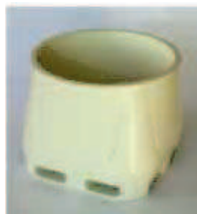
Cuerpo Monobloc de fácil limpieza.