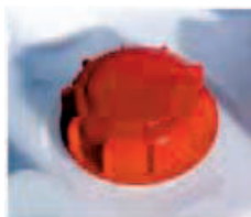
Tapa Roscada DN 150 FÁCIL y cómodo llenado.