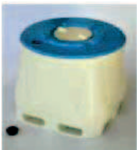
Boca de inspección y relleno de 120 mm DIÁMETRO