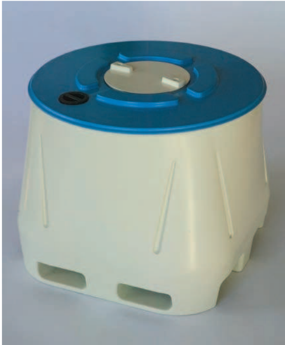
Transcuba de Apertura Total de 650 Lts Dimensiones 1170x1170x992mm Boca superior DIÁMETRO de 1088mm Tapa central 400 mm, Peso 60 kg.