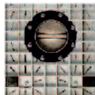
Válvula de Mariposa diam. 200 mm

Dimensiones ext. 1150x1300x1261 mm. Capacidad 1000 lts. Peso en vacío 130 kg. Peso máximo en Carga 1330 kg. Apilado en carga 2/1 con carga 1330 kg. Llenado boca de acceso e inspección diam. 400 y Tapa roscada diam. 100 mm. Sistema de Vaciado :Válvula de Mariposa diam. 200 mm