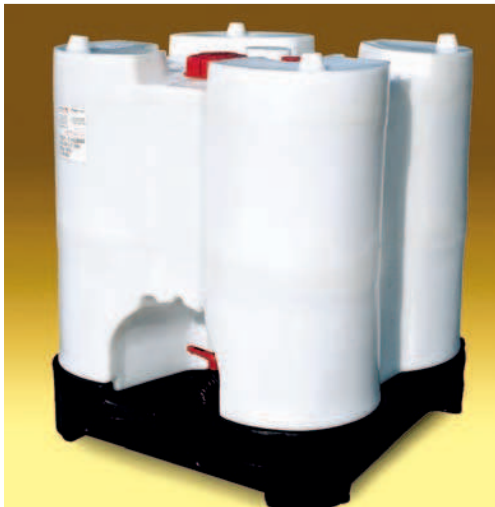
Transicuba plástico 1.000 lts., Dim. 1160x1160x1355 mm. Válvula de venteo, Tapa Roscada DN 150, válvula de esfera DN 50. Peso en vacío 89 Kg,