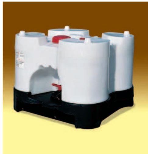
Transicuba plástico 600 lts., Dim. 1160x1160x1155 mm. Válvula de venteo, Tapa Roscada DN 150, válvula de esfera DN 50. Peso en vacío 77 Kg,