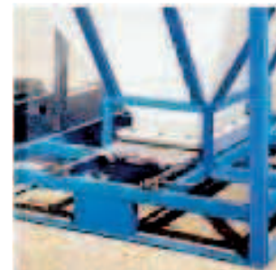
Cono de Fuerte pendiente

Dimensiones ext. 1200x1000x1620 mm. Capacidad 1000 lts. Peso en vacío 75 kg. Peso máximo en Carga 1275 kg. Apilado en carga 2/1 con carga 1160 kg. Llenado boca de acceso e inspección diam. 400 y Tapa roscada diam. 100 mm. Sistema de Vaciado :Compuerta con Tajadera inox. o galvanizada de 400x250mm.