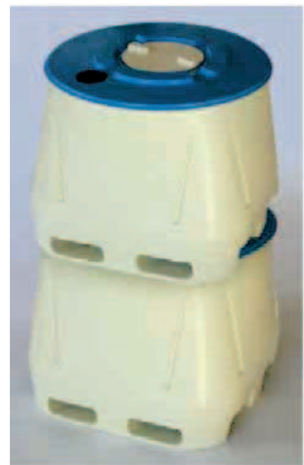
Apilable uno sobre uno a 850 kg de carga.