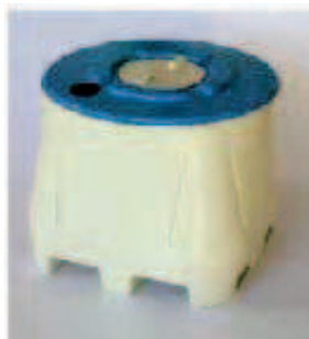
Entradas sin patines para traspaletas.