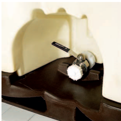
Válvula de esfera en Latón o acero inox. DN50, permite libre movimiento.