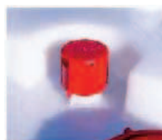
Venteo de 2 posiciones, hermético o desgasificador.

Aprovechamiento óptimo en los estándares de transporte. Interapilado perfecto y personalización de colores bajo pedido.