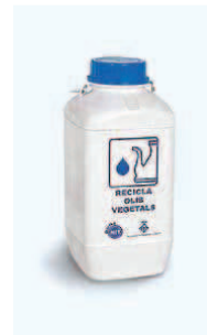
Recipiente para la recogida de aceite doméstico a Domicilio. Cap. 5 Lts, Asa transporte.