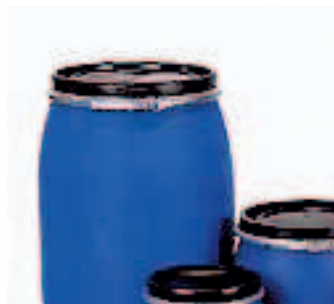
Bombonas con cierre tipo bayesta seguridad, usos variados, cap. de 30 a 220 lts.