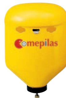
Contenedor para Pilas Usadas tipo bombilla, fijación en pared. Med. 410x240x579 mm.