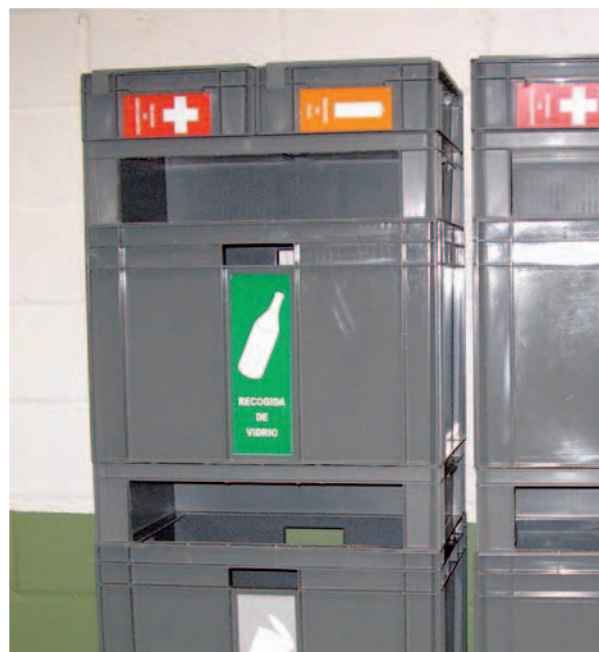
Composición Modular MEDIO AMBIENTE , multi-tembalaje, con plataforma rodante. Reciclado de PAPEL, PILAS USADAS, VIDRIO, LATAS y ÚTILES QUIRÚRGICOS.