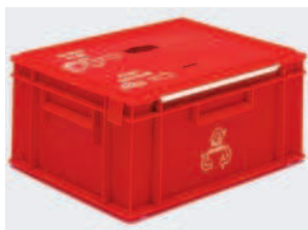
Contenedor para la recogida de Pilas Usadas, 400x300x246 mm, 20 Lts. Tapa Trokelada y cubeta interior pilas botón.