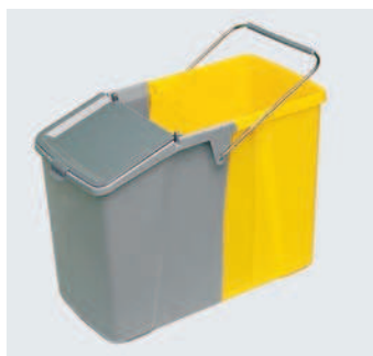
Cubo Domestico para la Recogida Selectiva, cap. 30 Lts, Asa y separador interior.