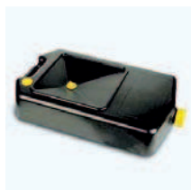
Recipiente para la recogida de aceite usado Automoción. Cap. 5-10-12 Lts