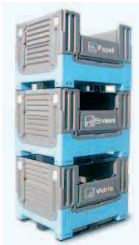
Composición modular MEDIO AMBIENTE de Contenedor Plegables y con puerta Abatibles, personalizado SEGÚN demanda. Dimensiones 1200x1000x900 mm Versiones con Patines y con tacos de apoyo.